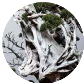
あてやかモノガタリ。 「BONSAI MEETS JAPAN, AGAIN」 期間：2018年4月23日(月)～5月13日(日)