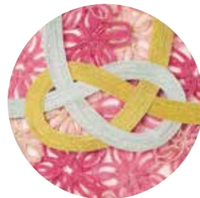
しとやかモノガタリ。 「COLORS OF THANKS」 期間：2019年3月13日(水)～3月31日(日)