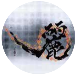
うららかモノガタリ。 「DRAW YOUR SEASON」 期間：2018年9月15日(土)～10月8日(月・祝)