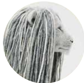
まめやかモノガタリ。 「BORN FROM NATURE, MERINO WOOL」 期間：2018年11月23日(金・祝)～12月25日(月)